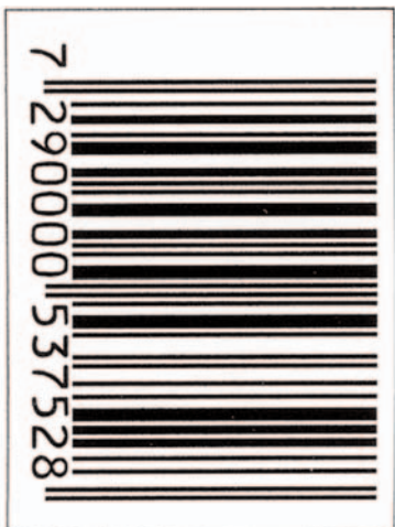
Israels landskod är 729.

Det palestinska folket behöver vår solidaritet. Vi kräver kommunal inköpsbojkott av israeliska varor, men även du som konsument kan bojkotta Israel. Se listan på israeliska varor på vår tidning Proletärens hemsida: proletaren.se